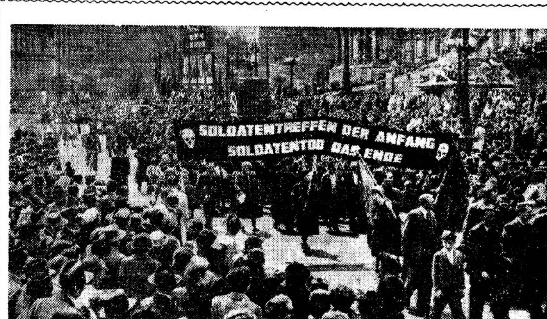
Демонстрация трудящихся Вены (Австрия). Изображенная на фотографии группа демонстрантов несет транспарант с надписью, протестующей против участия в последнее время в Австрии всевозможных «выстрел» бывших гитлеровских войск. «Начало — солдатские встречи, конец — солдатская смерть», — написано на плакате.

Главный редактор Б. РЮРИКОВ. Редакционная коллегия: Б. АГАПОВ, А. АНАСТАСЬЕВ, Н. АТАРОВ, Г. ГУЛИА, А. КОРНЕЙЧУК, В. КОРОТЕЕВ, В. КОСОЛАПОВ (зам. главного редактора), А. КРИВИЦКИЙ, В. ОЗЕРОВ (зам. главного редактора), К. ПАУСТОВСКИЙ, Н. ПОГОДИН, С. СМОРНОВ.