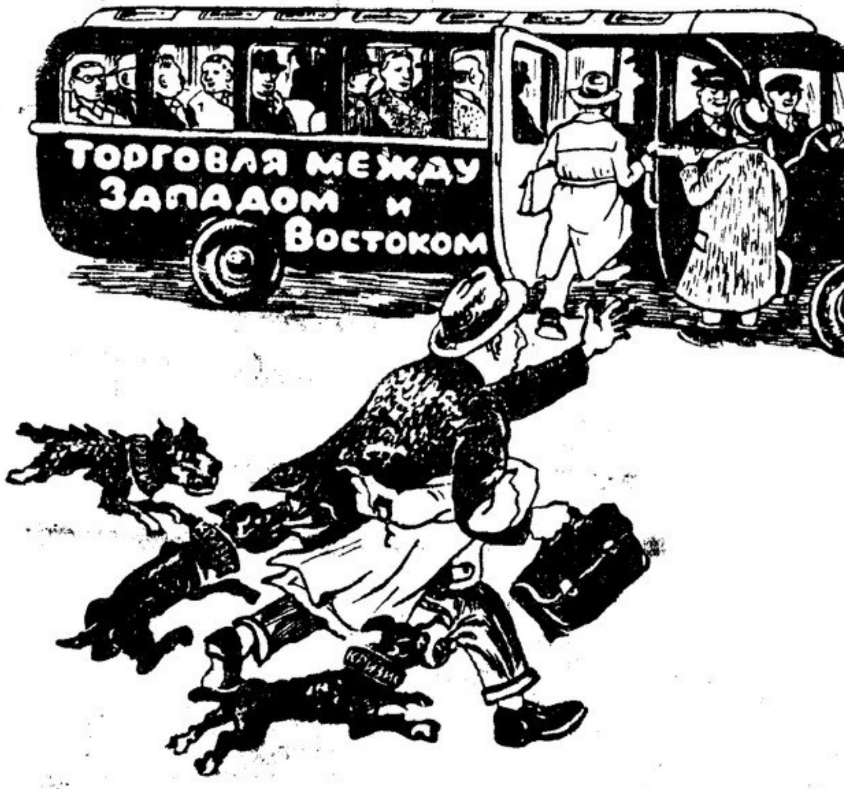
Того, кто опаздывает, кусают собаки... Рисунок немецкого худ. Вильяма