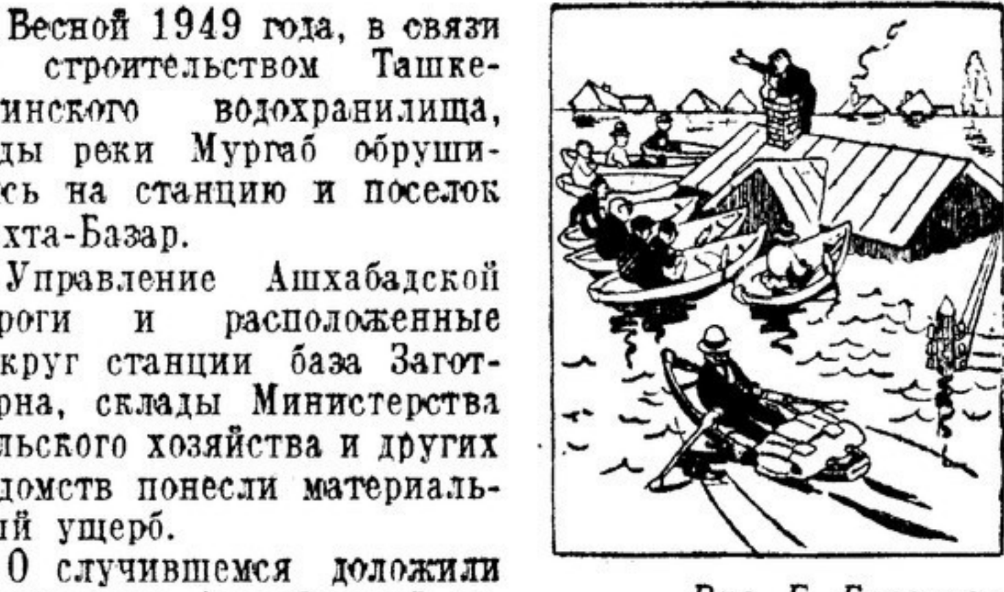
Рис. Е. Горюхова

Воспоминания о том, что было в Тахта-Базаре, когда вода вышла из берегов, и люди жили в лодках, — это воспоминания о «Венеции» Тахта-Базарской. Воспоминания о том, что было в Тахта-Базаре, когда вода вышла из берегов, и люди жили в лодках, — это воспоминания о «Венеции» Тахта-Базарской.