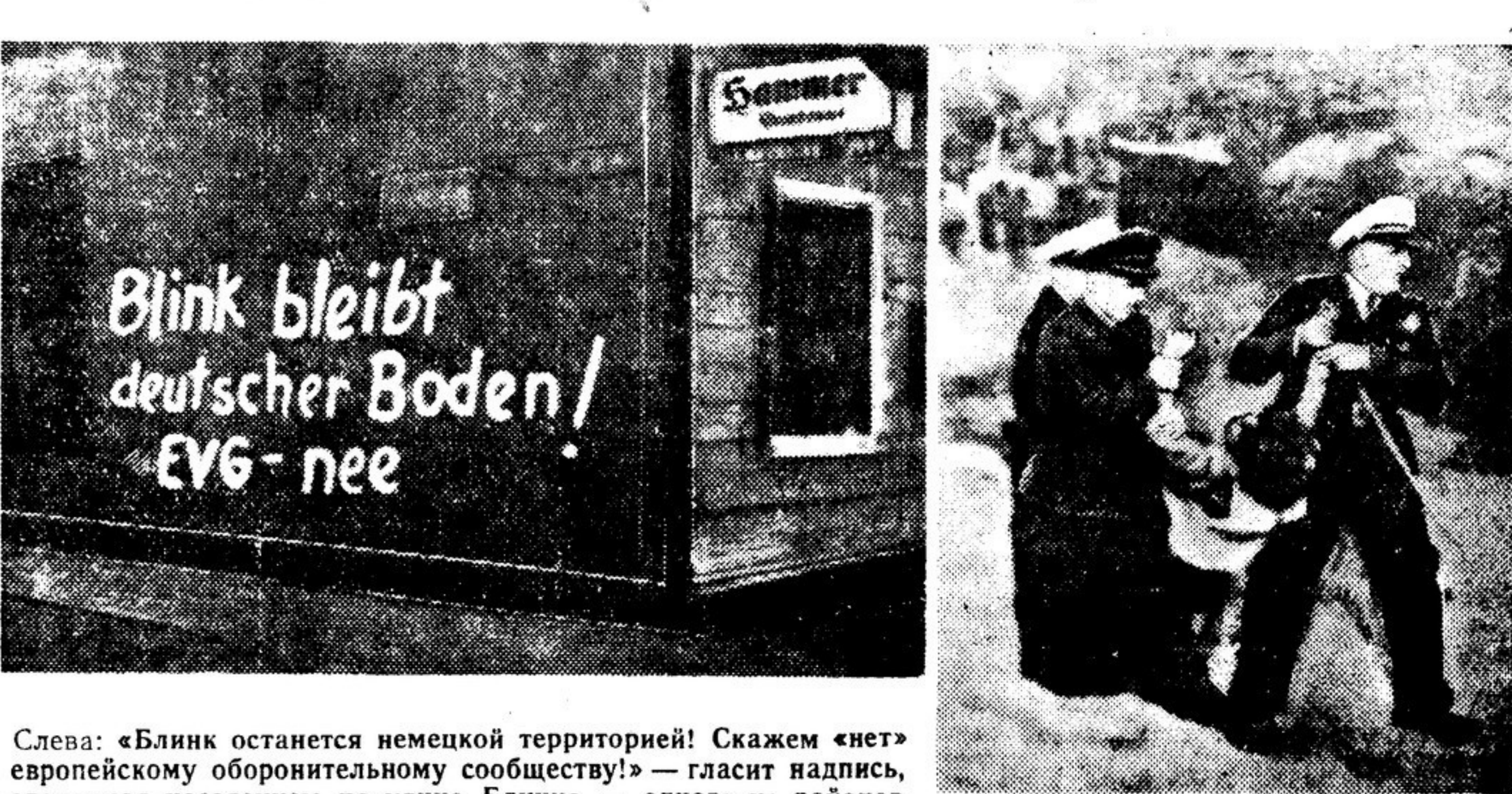
Слева: «Блинк останется немецкой территорией! Скажем «нет» европейскому оборонительному сообществу!» — гласит надпись, сделанная населением на улице Блинка — одного из районов западногерманского города Бремерхафена. Справа: аденауэровская полиция расправляется с жителями Блинка, отказавшимися выполнить требования американцев и покинуть свои дома. Снимки из газет «Нейес Дейтланд» и «Теглицхе рундшдт»

Население Западной Германии ведет борьбу за повышение своего жизненного уровня, против антинародной политики боннской клики, служащей интересам американских монополий и милитаристов против провозглашения американских оккупантов, против так называемого «европейского оборонительного сообщества». Ярким отражением этой борьбы явились события, которые разыгрались в западногерманском городе Бремерхафене. Бремерхафен — портовый город. Американцы превратили его в свою военную базу. Есть в Бремерхафене район, называющийся Большой Блинк. Недавно американские военные власти, обложившие этот район, заявили, что они хотят снести здесь целый ряд жилых домов и построить на их месте военные объекты.